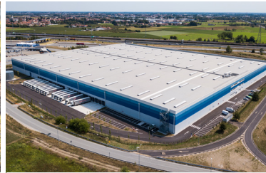
CENTRE DE LOGISTIQUE MESERO Mesero, Italie Partenaire | AXA IM