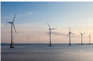
FORMOSA II, PROJET ÉOLIEN Asie-Pacifique Partenaire | Stonepeak