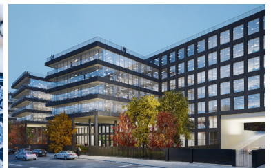
IMMEUBLE DE BUREAUX BLACK Paris, France Partenaire | AXA IM