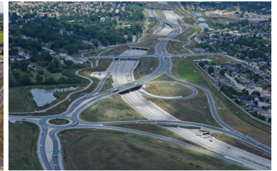
PROMENADE RIGHT HONOURABLE HERB GRAY Ontario, Canada Partenaire | Connor, Clark & Lunn Infrastructure