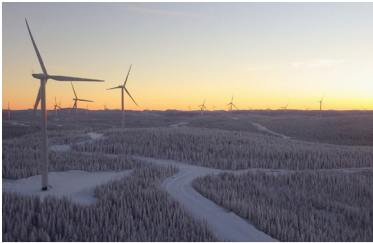
PARC ÉOLIEN DE RIVIÈRE-DU-MOULIN Québec, Canada Partenaire | EDF Renouvelables