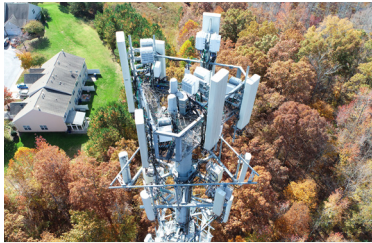
TOUR DE TÉLÉCOMMUNICATION HARMONY Ohio, États-Unis Partenaire | Ardian