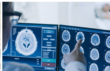
SOCIÉTÉ NATUS MEDICAL Wisconsin, États-Unis Partenaire | ArchiMed