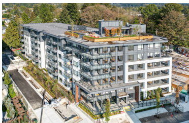
LYNMOUR Vancouver, Canada Partenaire | Realstar